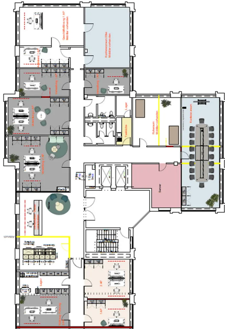
Grundriss 3. OG