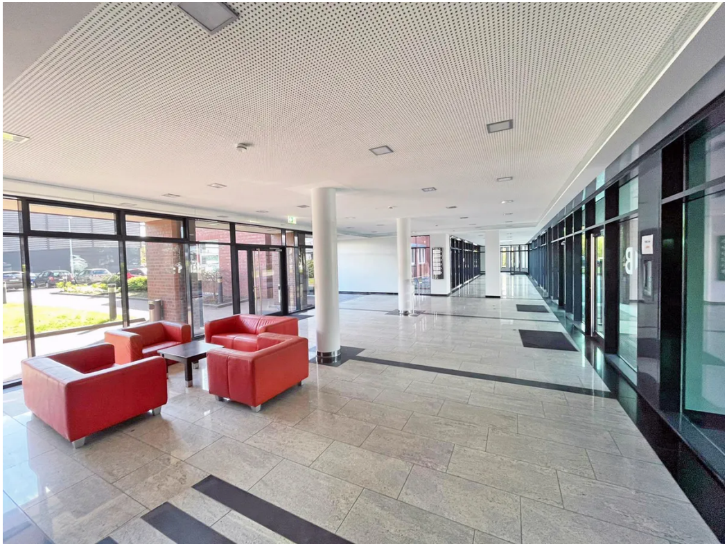
Weitere Ansichten - Entree