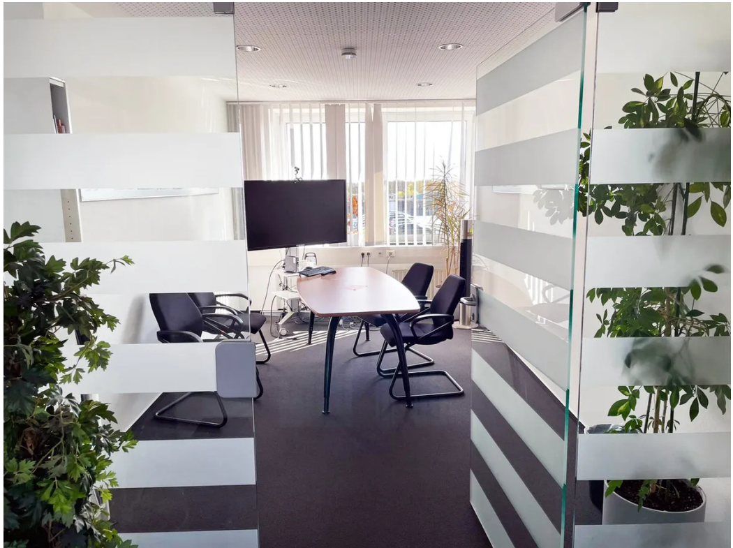
Beispielansicht - Konferenz