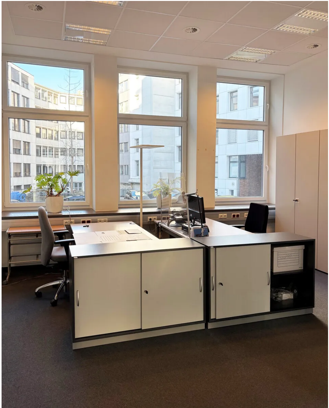
Weitere Ansichten - EG