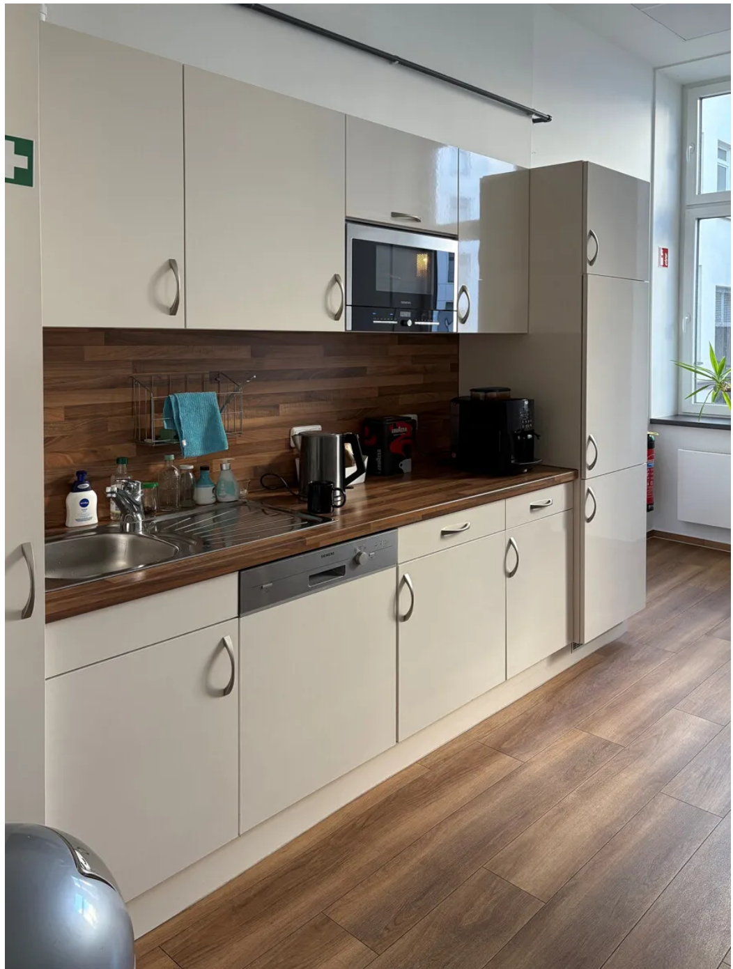
Weitere Ansichten - EG