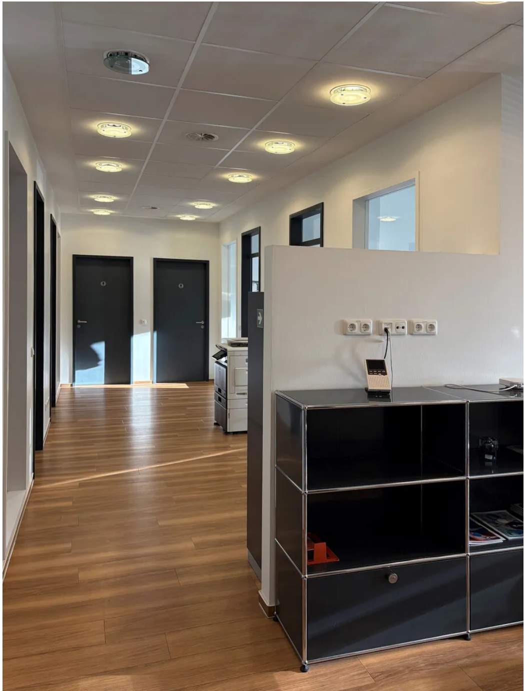
Weitere Ansichten - EG