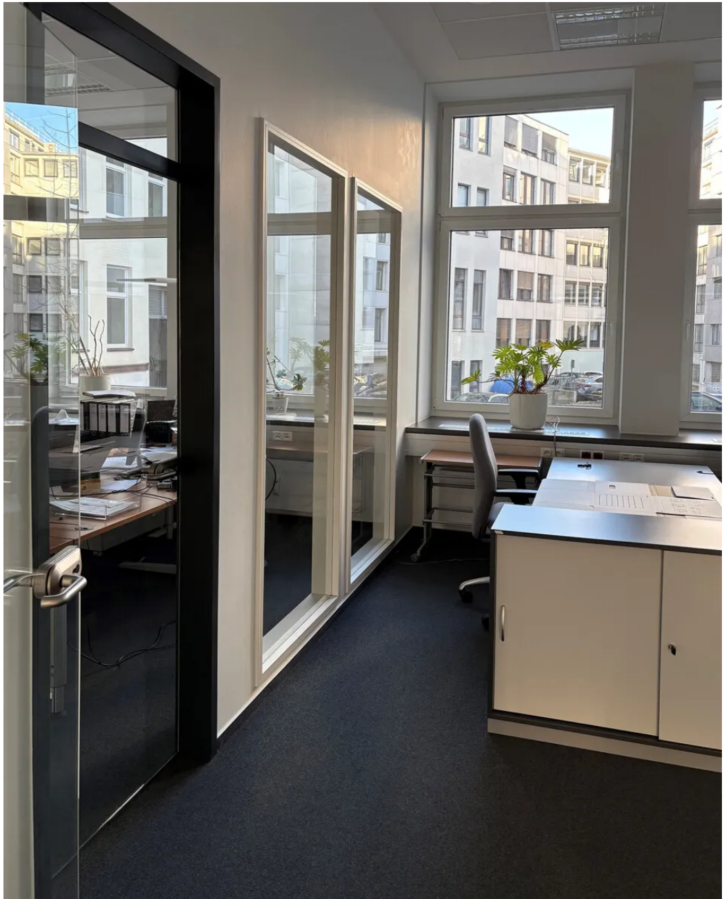
Weitere Ansichten - EG