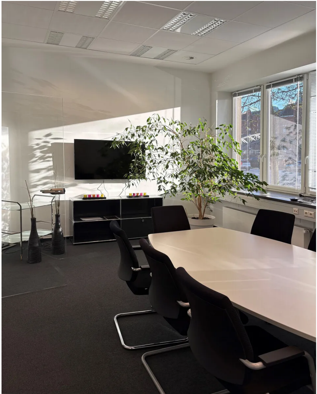
Weitere Ansichten - EG