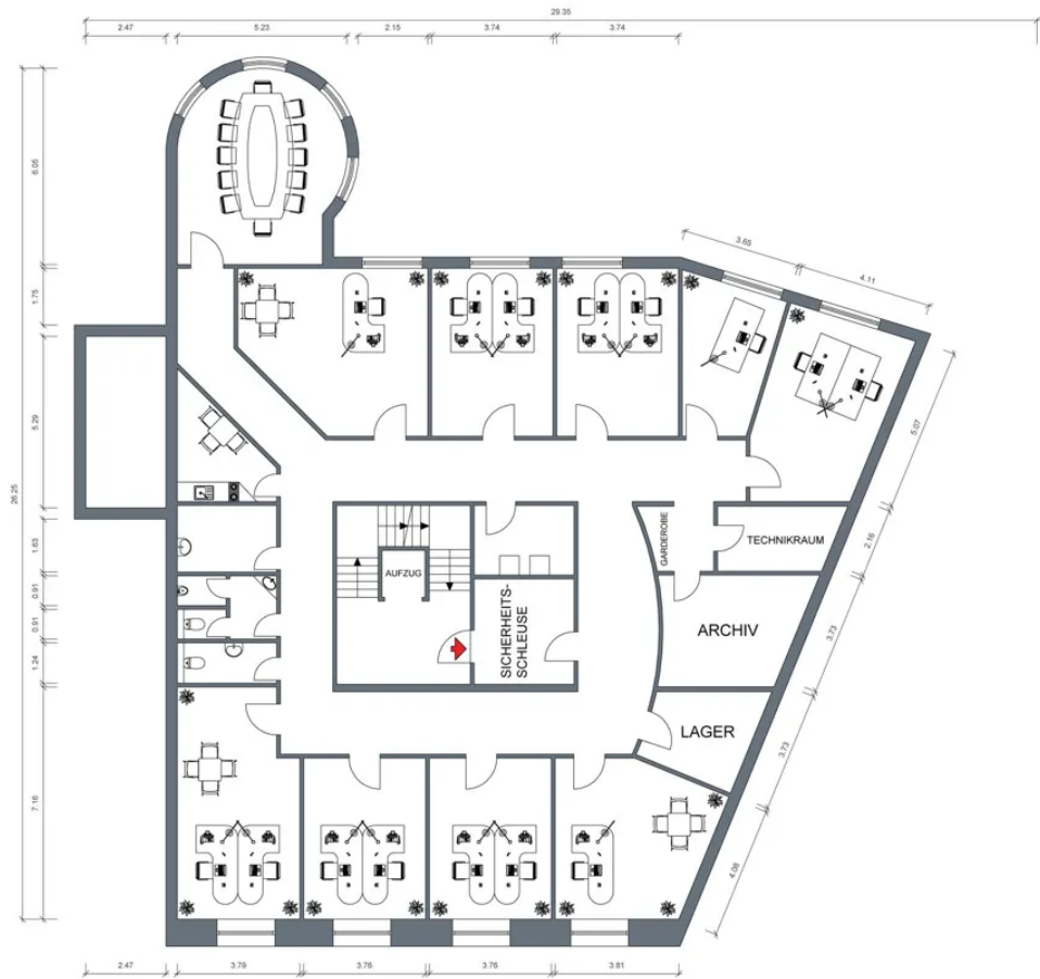
Grundriss 3. OG