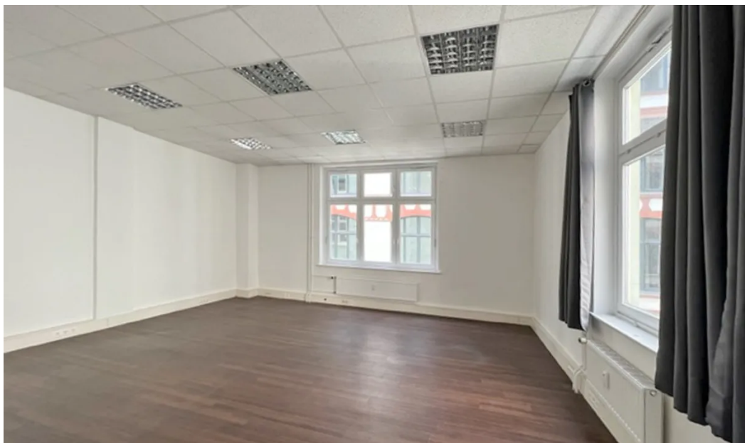
Weitere exemplarische Ansichten