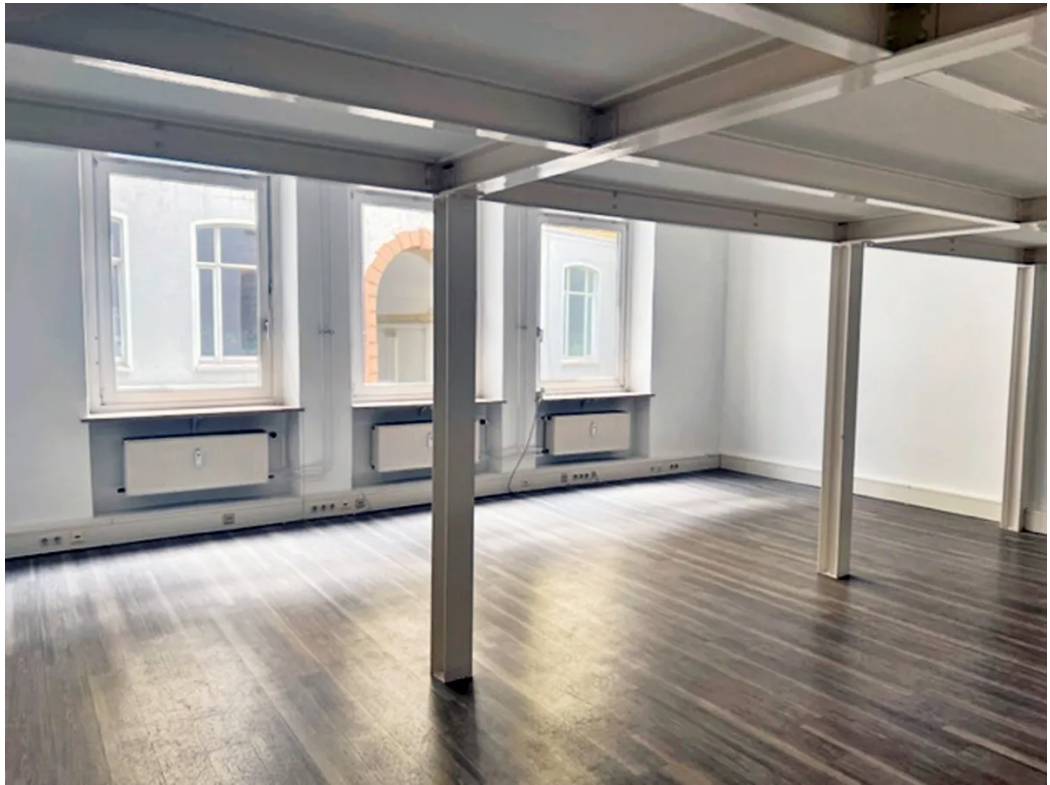
Weitere exemplarische Ansichten