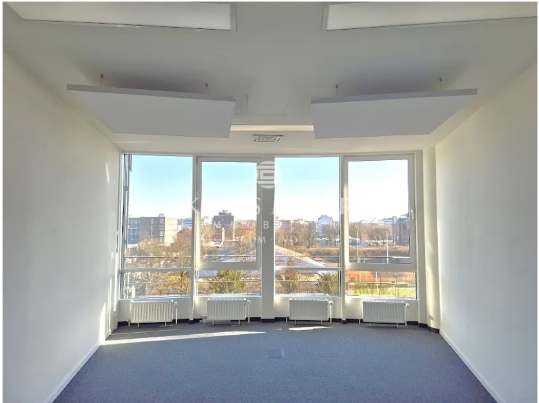
k1150-20260304_103440 oror kmi55