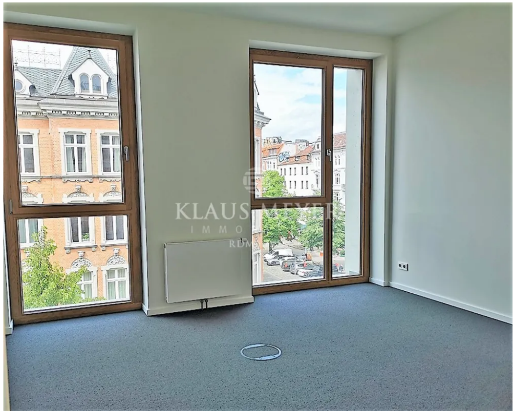
Büros mit Ausblick