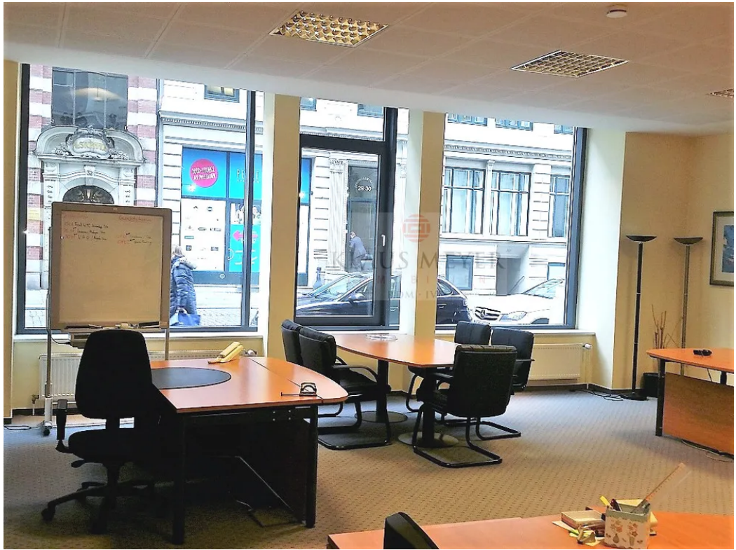
Büro zur Straße