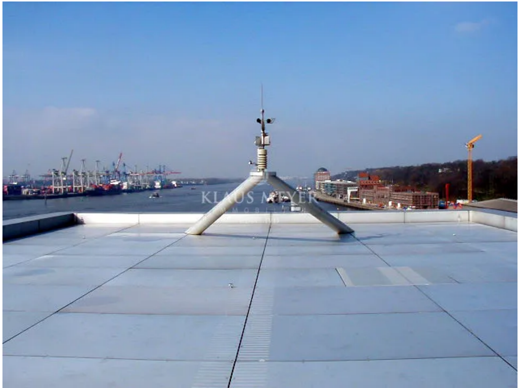
Hier sind Sie der Kapitän