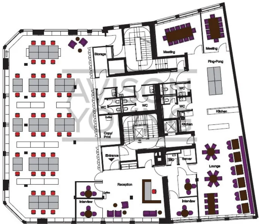
Haus 50-52 | 1. OG | 631 m 2