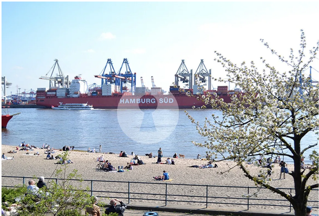
Der Hamburger Hafen