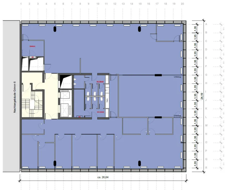
Grundriss 5. OG