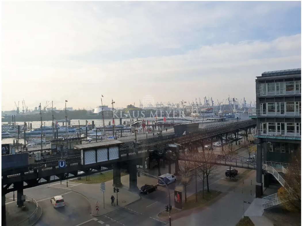
schon aus dem 4.OG ein toller Blick