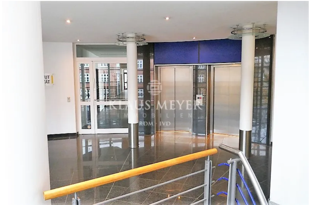
Fahrstuhl direkt TG