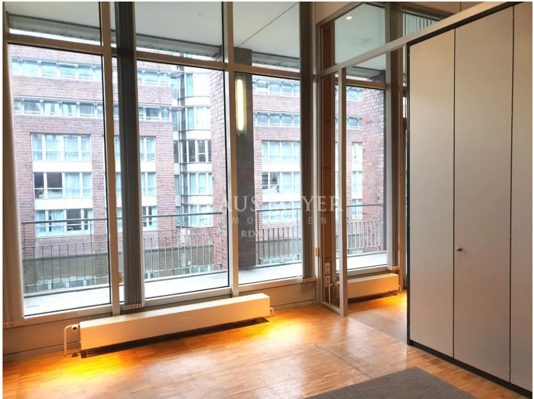
ruhig am Fleet