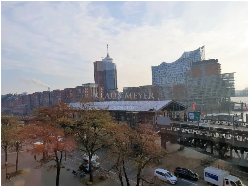
schon aus dem 4.OG ein toller Blick