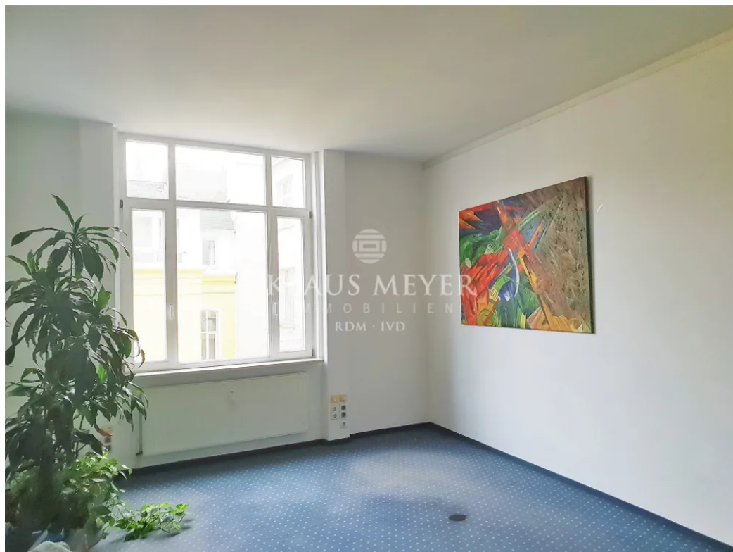
3.OG ca. 403,5 m 2