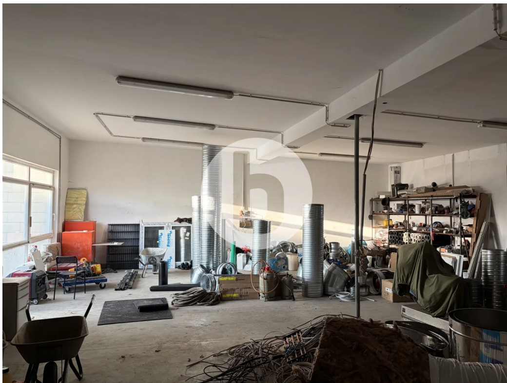
Lager mit ca. 150m 2