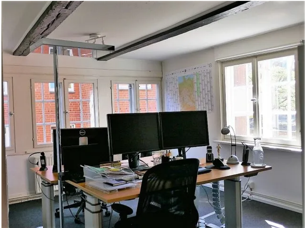
Beispiel im Büro