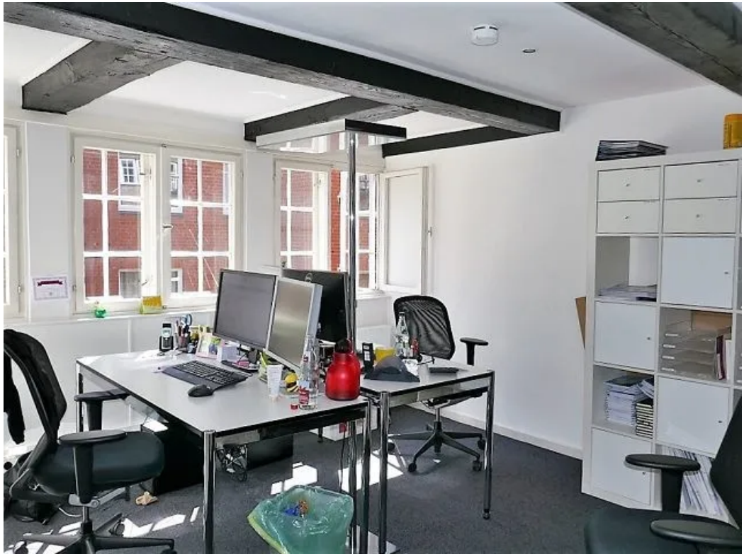
Beispiel im Büro