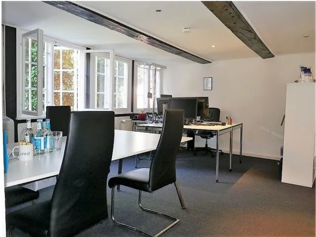
Beispiel im Büro