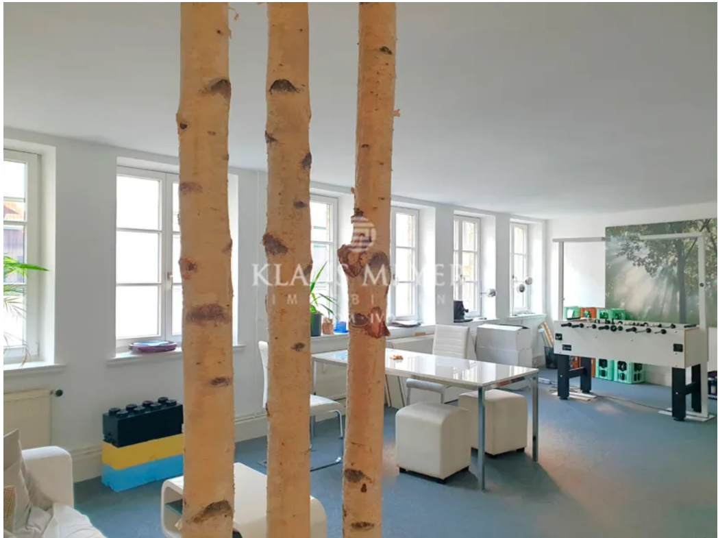
3.OG Weitere Räume mögl.