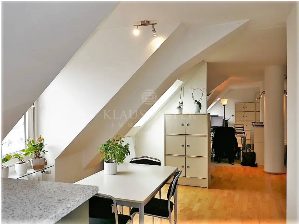
im 6. OG