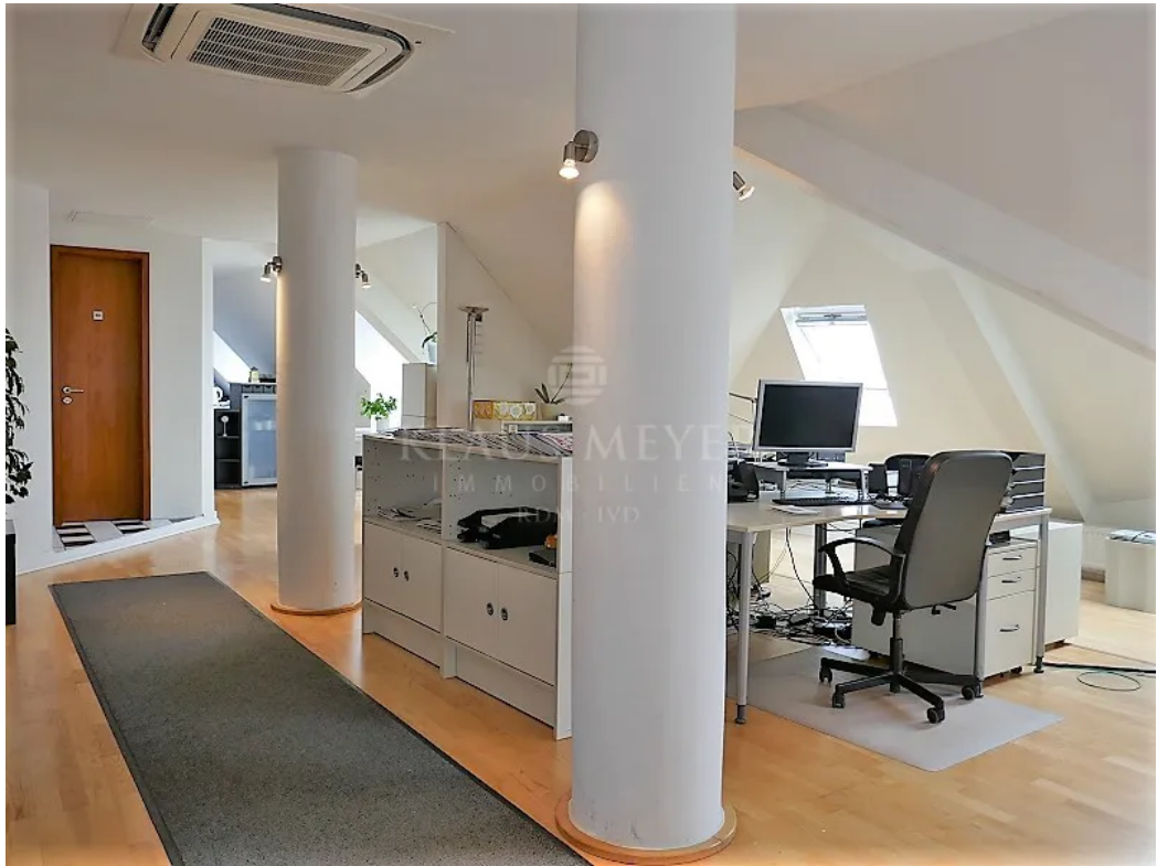
im 6. OG