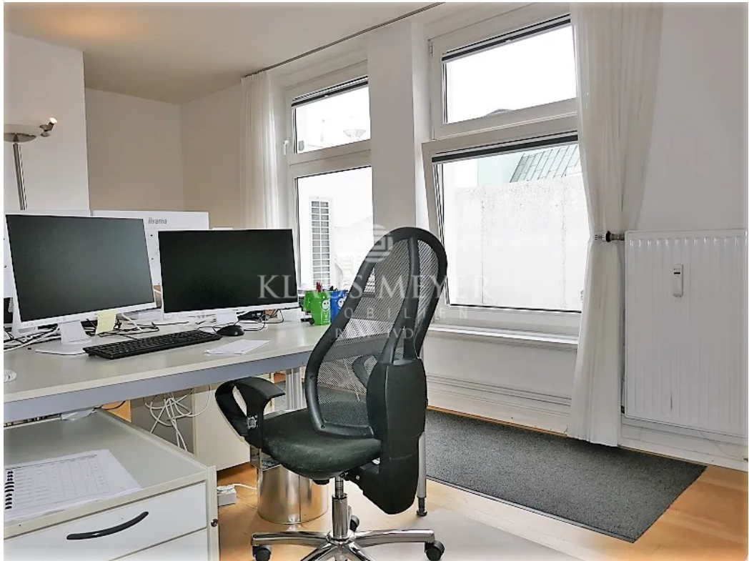
im 6. OG