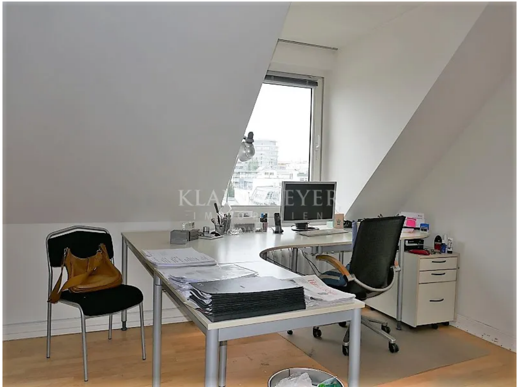
im 6. OG