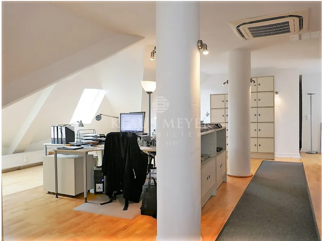
im 6. OG