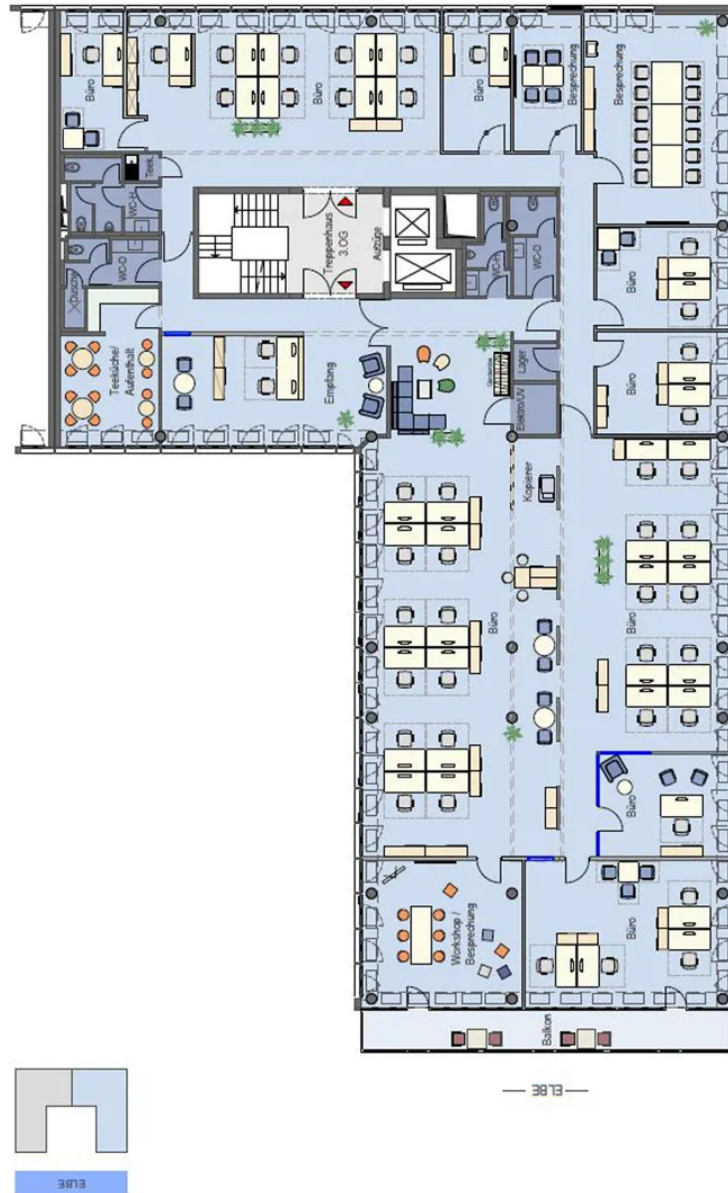
Grundriss 3. OG