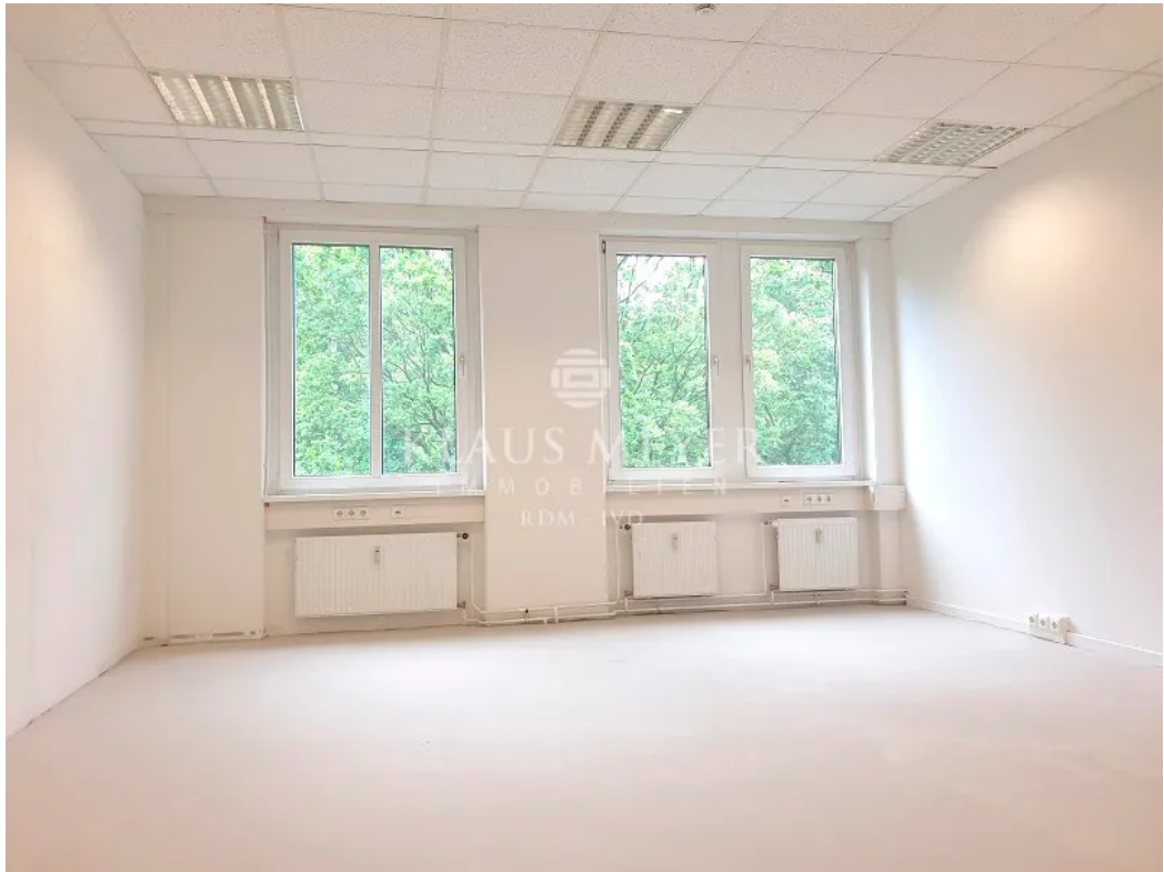
Blick ins Grüne