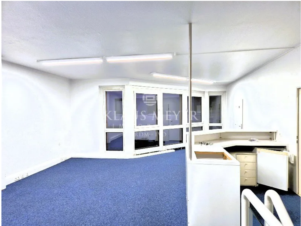
Teilfläche ca. 144,3 m 2