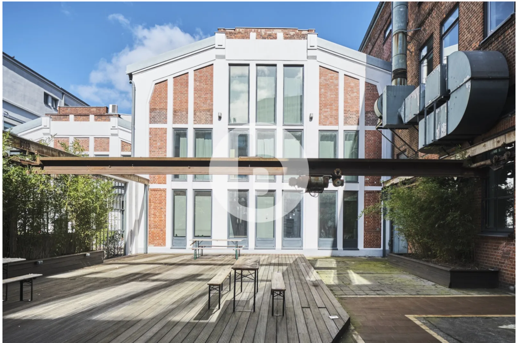
Conz-Höfe Hamburg-Bahrenfeld Büro Innenansicht