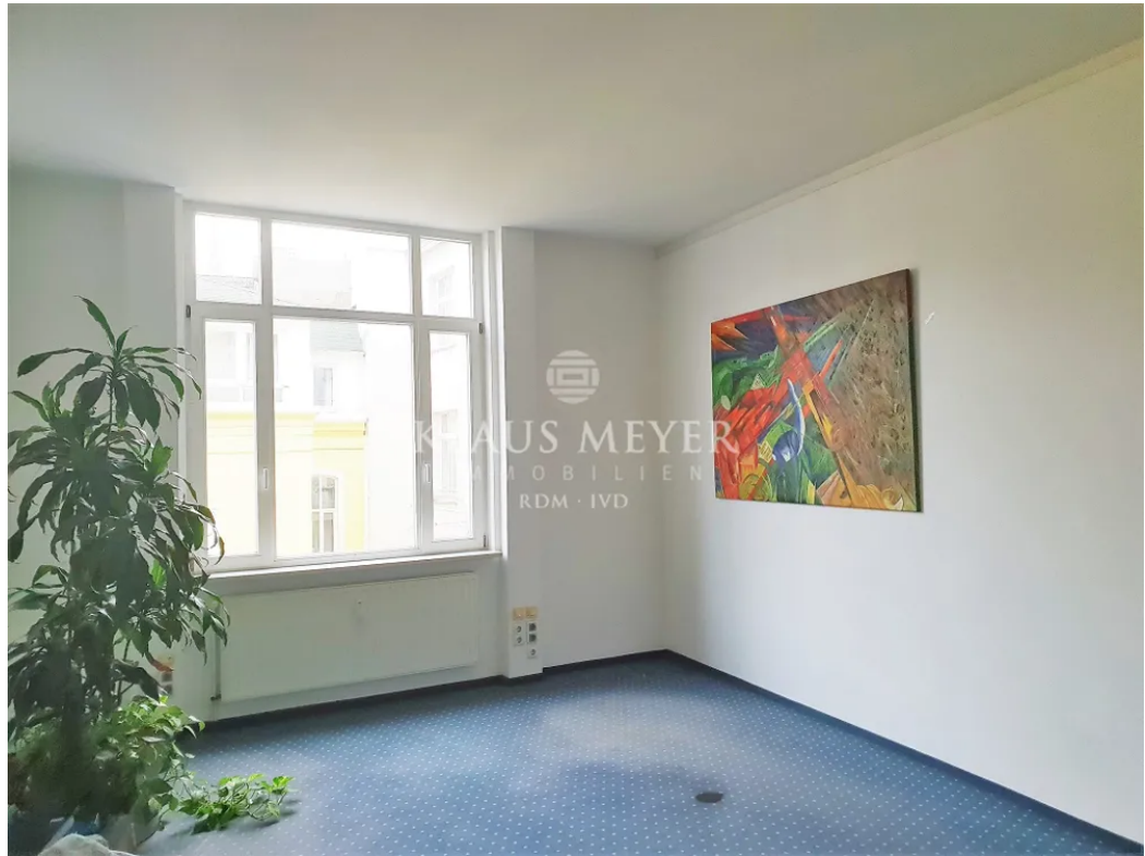
3.OG ca. 403,5 m 2