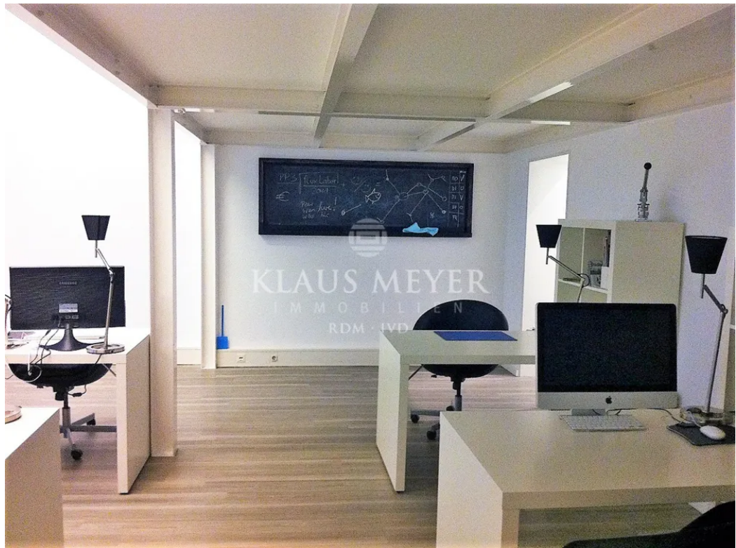
auf der Galerie