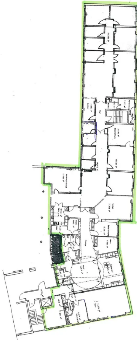
Grundriss 1. OG - ca. 798m 2