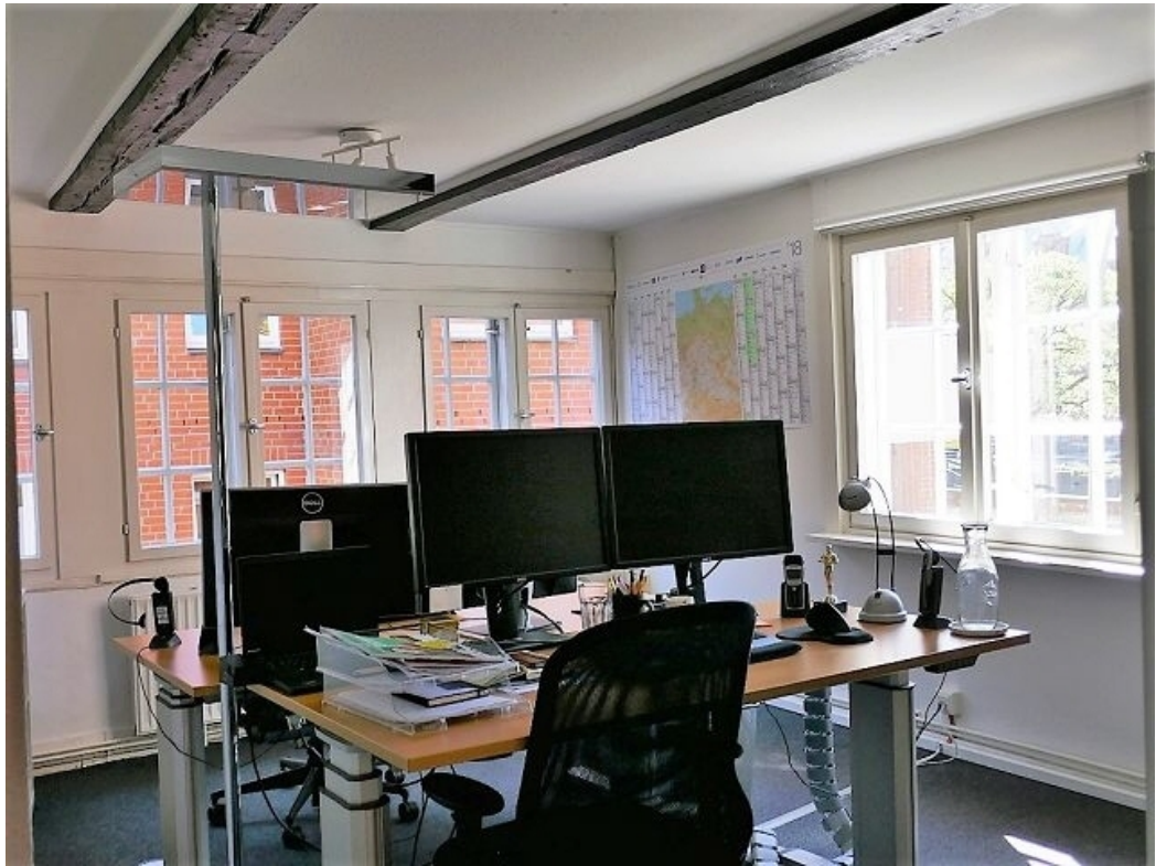
Beispiel im Büro