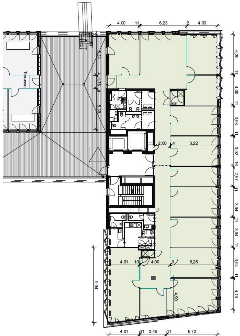
GR Ebene 3