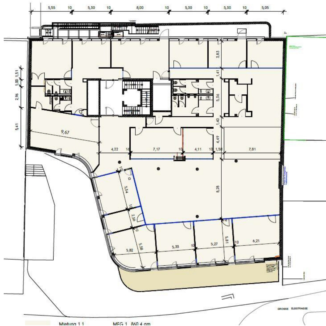
GR Ebene 1