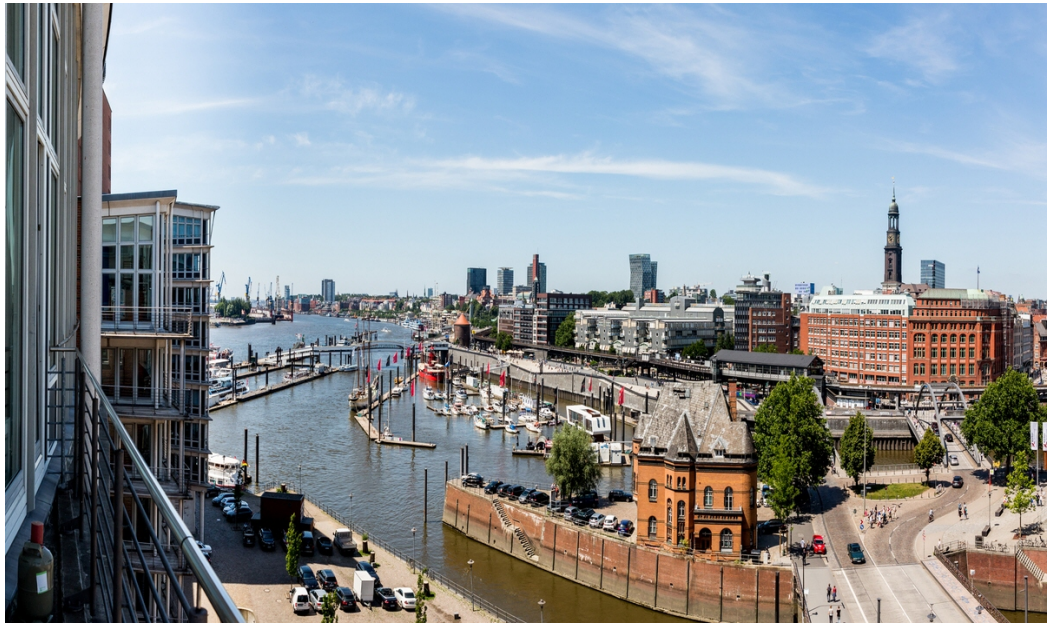
Weitere Ansichten - Ausblick