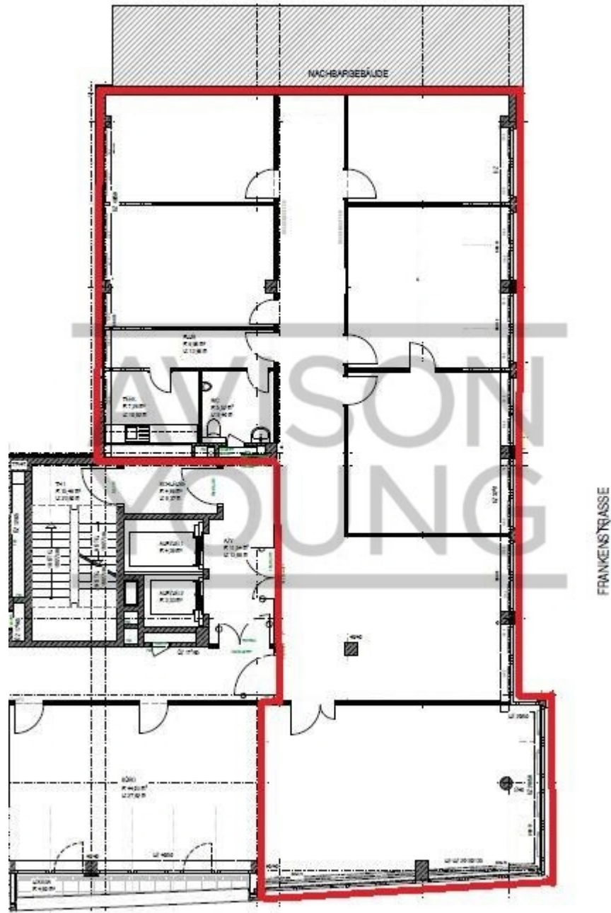
5 OG 290 m 2