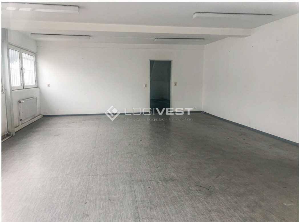
Musterbild - Büroflächen