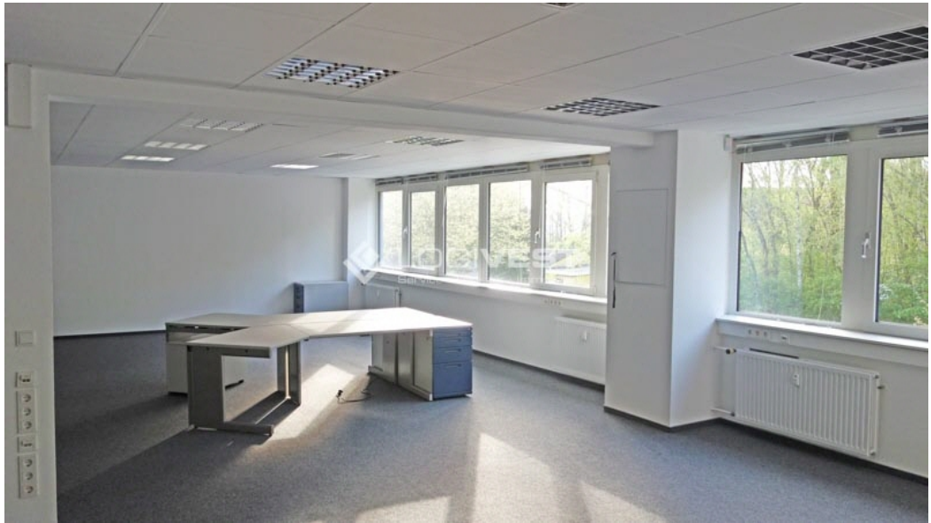
Musterbild Service- und Bürofläche