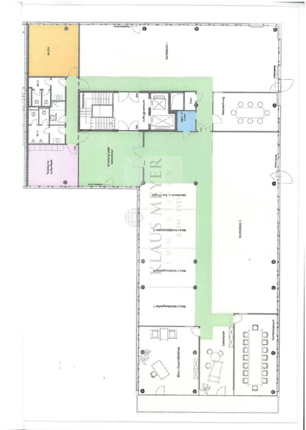
4 OG ca 730 m 2