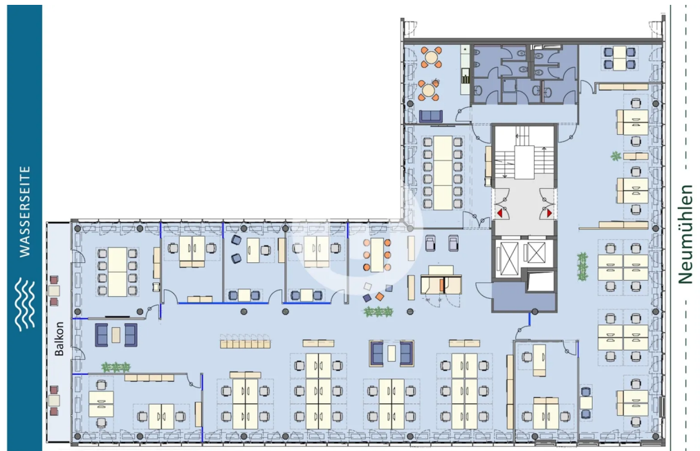
4. Obergeschoss mit ca. 730 m 2 , teilbar ab ca. 334 m 2 - beispielhafte Raumaufteilung