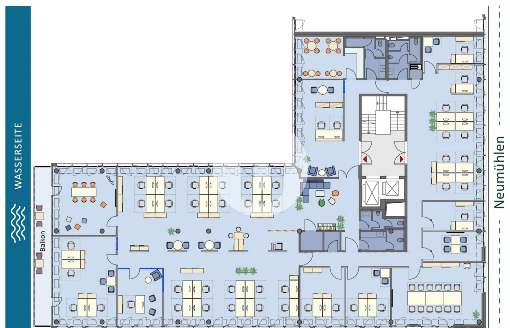
3. Obergeschoss mit ca. 730 m 2 - beispielhafte Raumaufteilung