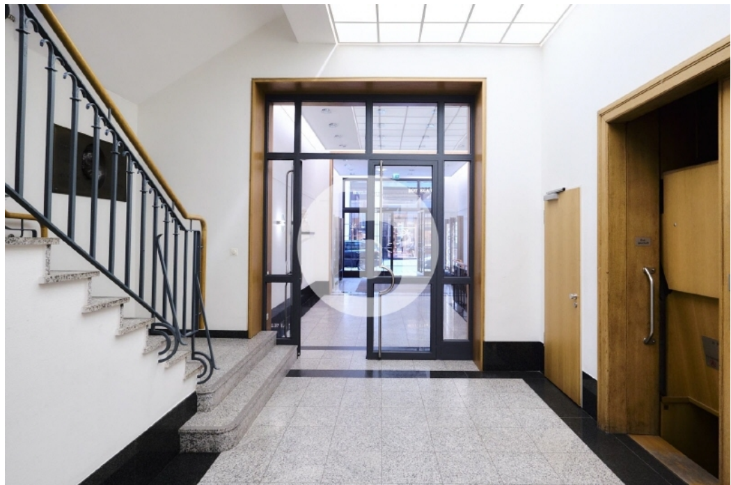
Neuer Wall 72 DSCF2175 2MP