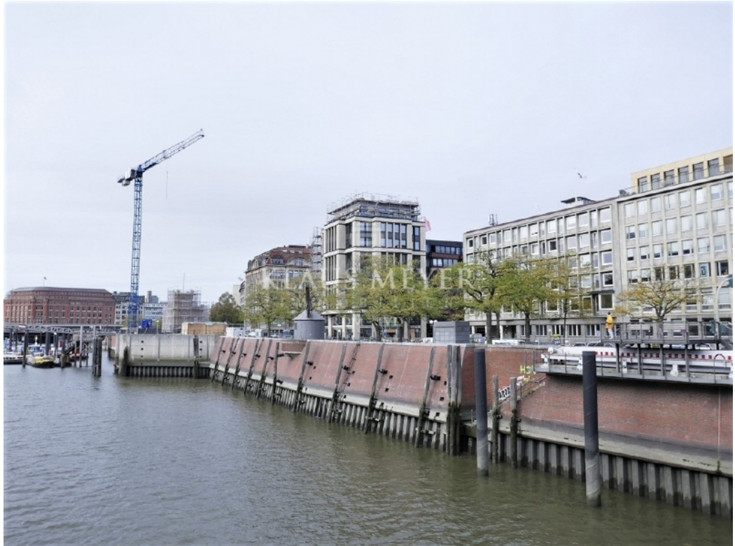
Ansicht u Umfeld