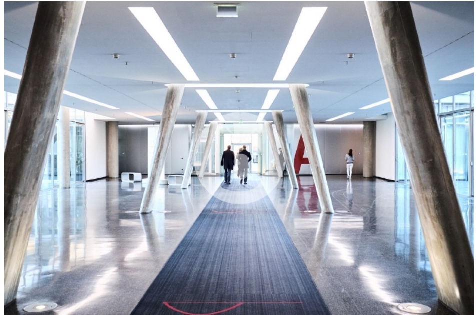
Berliner Bogen Anckelmannsplatz 1 Hamburg City Süd Bürogebäude Innenansicht