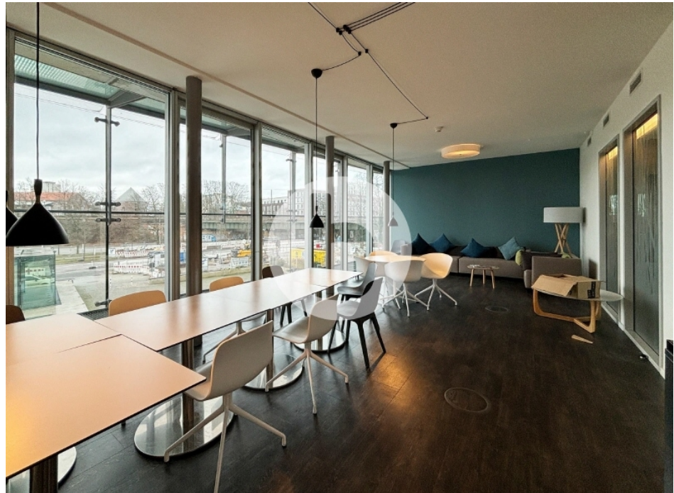
Innenansicht 1 Obergeschoss mit ca 1050 m 2