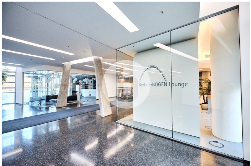
Berliner Bogen Anckelmannsplatz 1 Hamburg City Süd Bürogebäude Innenansicht