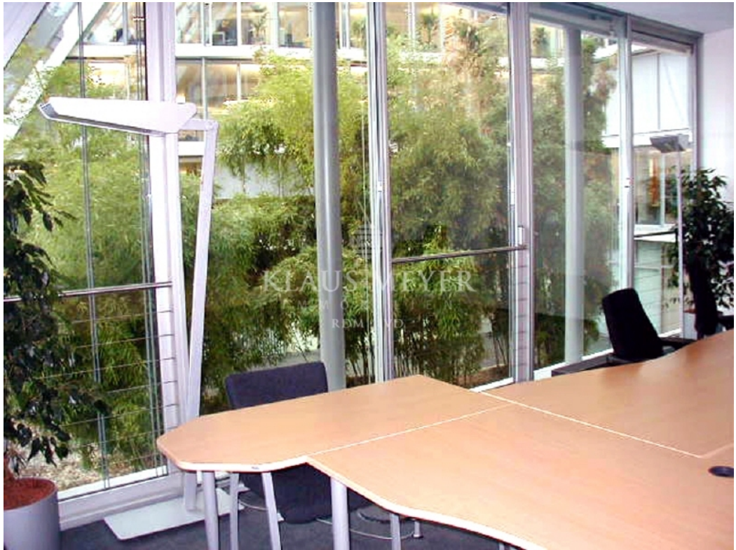
Büro am Atrium