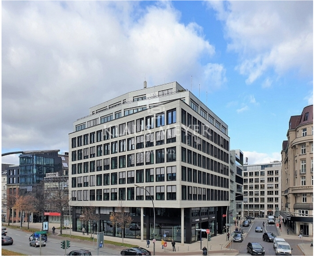
an der Ampel