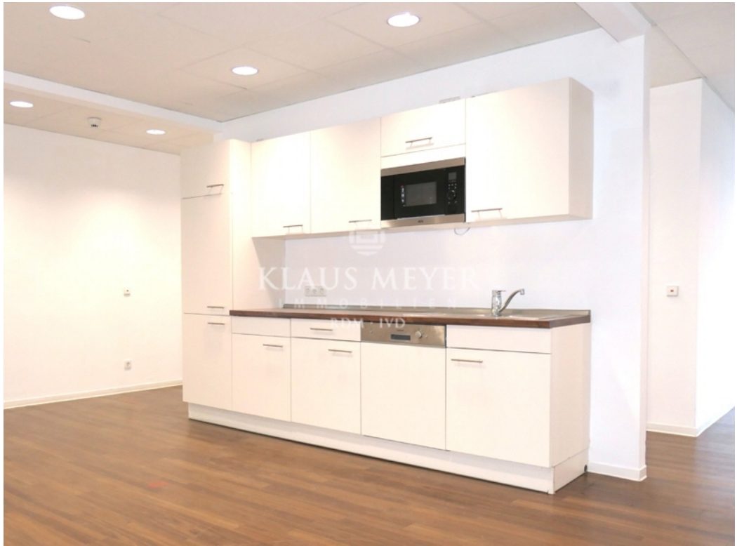
Beispiel f Pantry