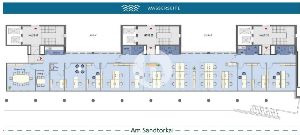
2 Obergeschoss mit ca 434 m 2 - beispielhafte Raumaufteilung