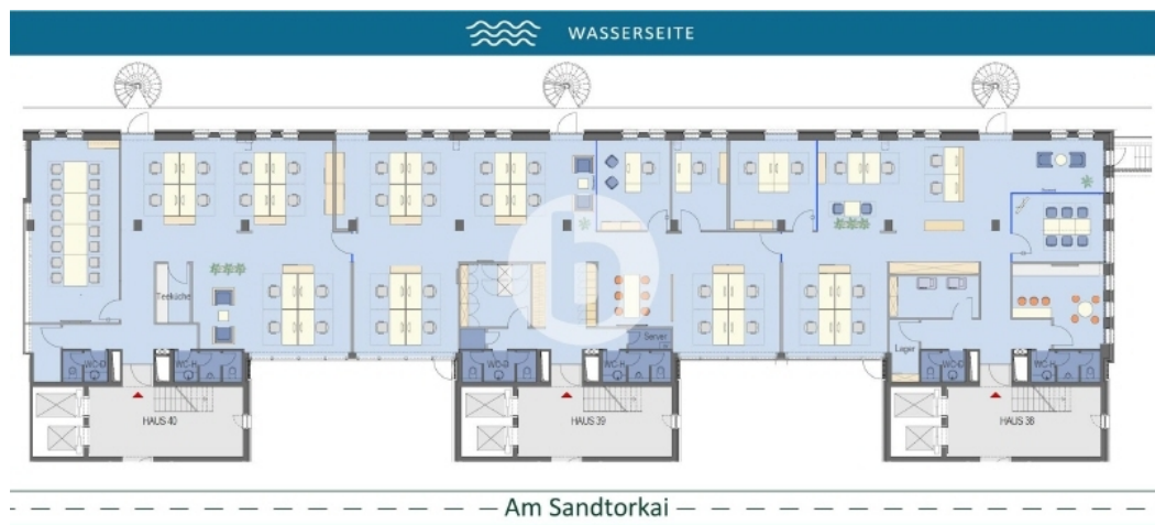
1 Obergeschoss mit ca 670 m 2 - beispielhafte Raumaufteilung