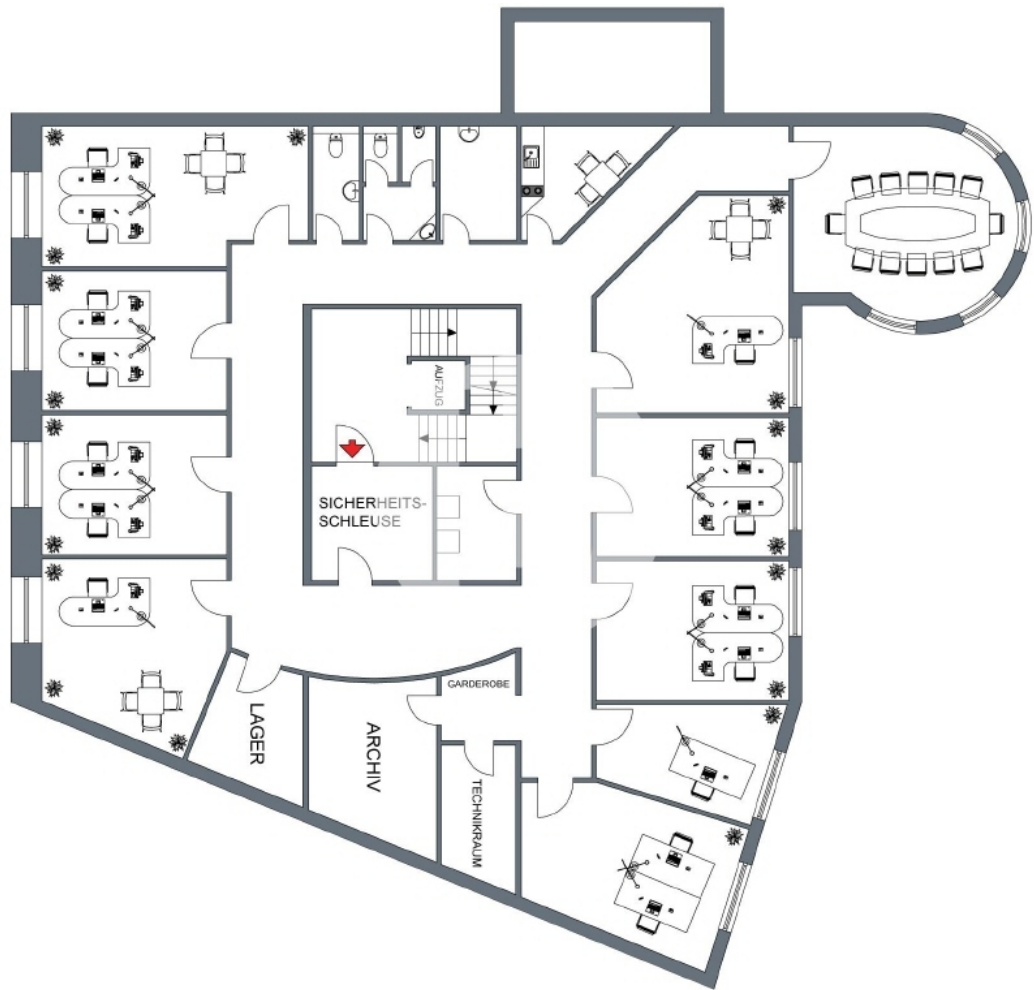
Zippelhaus 5 - 3 Obergeschoss mit ca 404 m 2