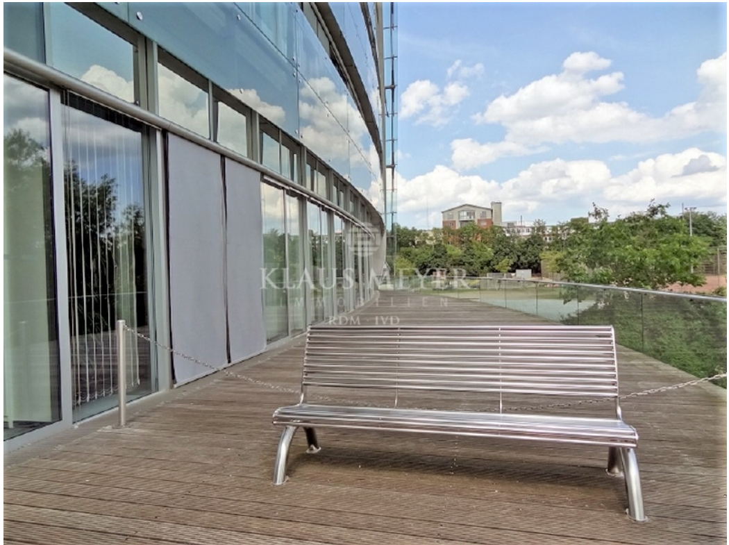
gemeinsch Terrasse EG Fleet