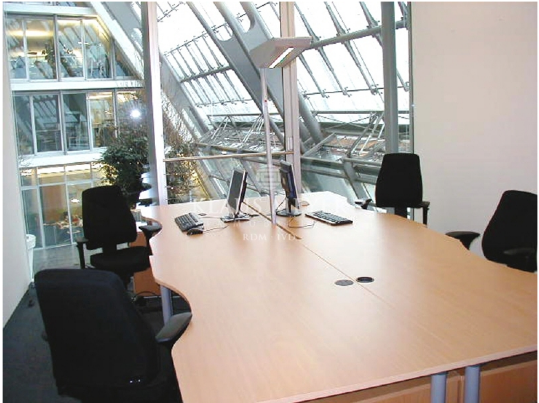
Büro am Atrium