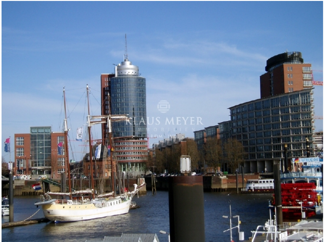
Gebäudekomplex Columbus amundsen Elbansicht kmi weiss 49