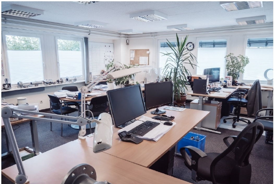
Innenansicht Beispiel 3 Büro