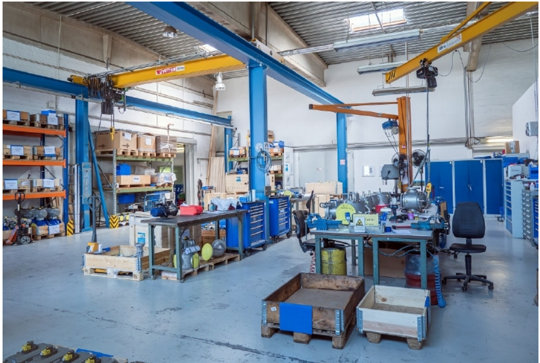
Innenansicht Beispiel 1