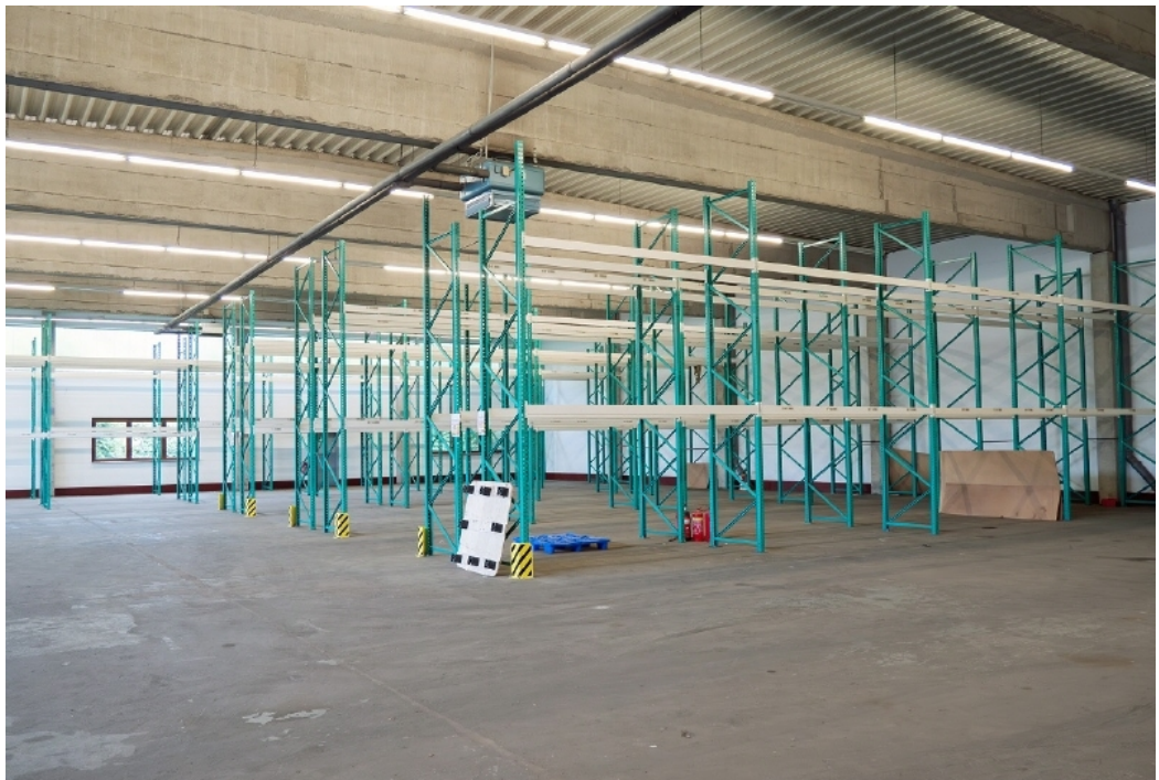
Innenansicht Beispiel 2