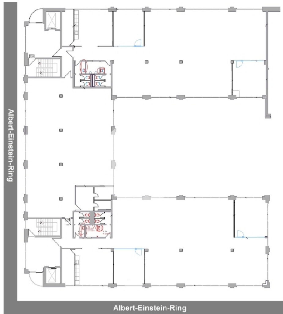
1 Obergeschoss mit ca 1019 m 2