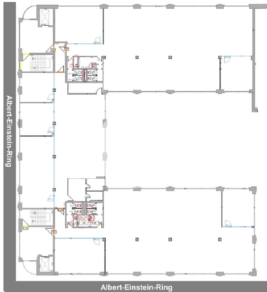
2 Obergeschoss mit ca 1021 m 2