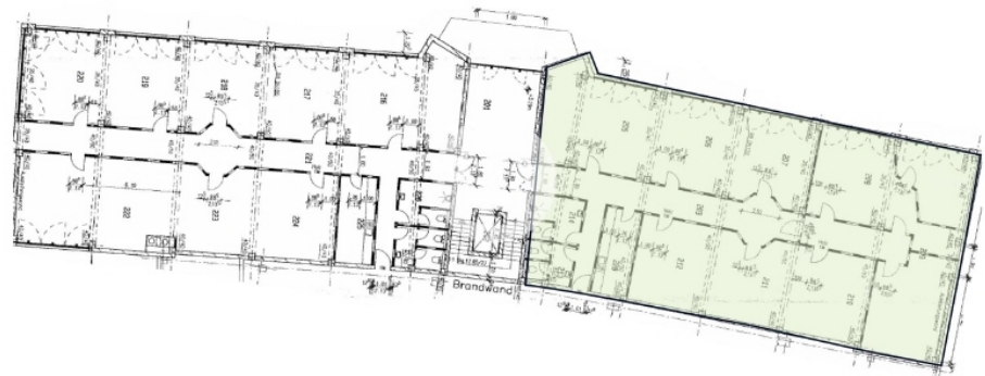
1 Obergeschoss mit ca 356 m 2