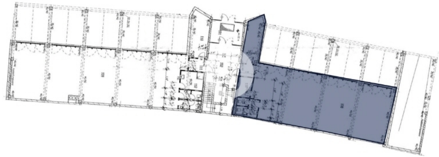
Erdgeschoss mit ca 206 m 2