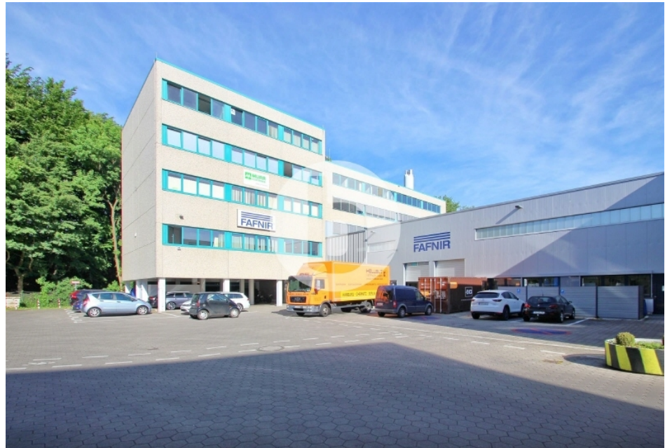
Schnackenburgallee 149 22525 Hamburg Büro Halle Außenansicht