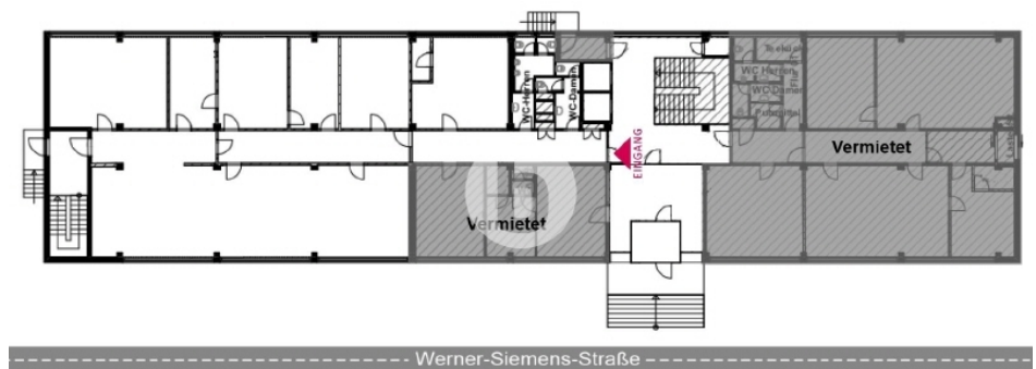
Erdgeschoss mit ca 405 m 2