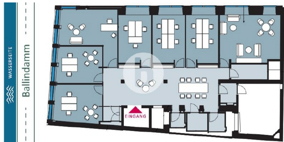
Regelgeschoss mit ca 272 m 2